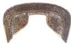
磐田丸山古坟出土的马鞍配件(国宝·磐田八幡宫收藏)

A2 古坟里埋葬着死者。棺槨中除了葬有死者的遗体之外,还放有死者的随身用品。其中包括铠甲及马具、镜子等,因死者的身份及职业、年代的不同,随葬品也是五花八门。当中还有一些十分珍贵的物品以及来自海外的舶来品。