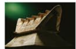
栗家古坟出土的雁形陶俑