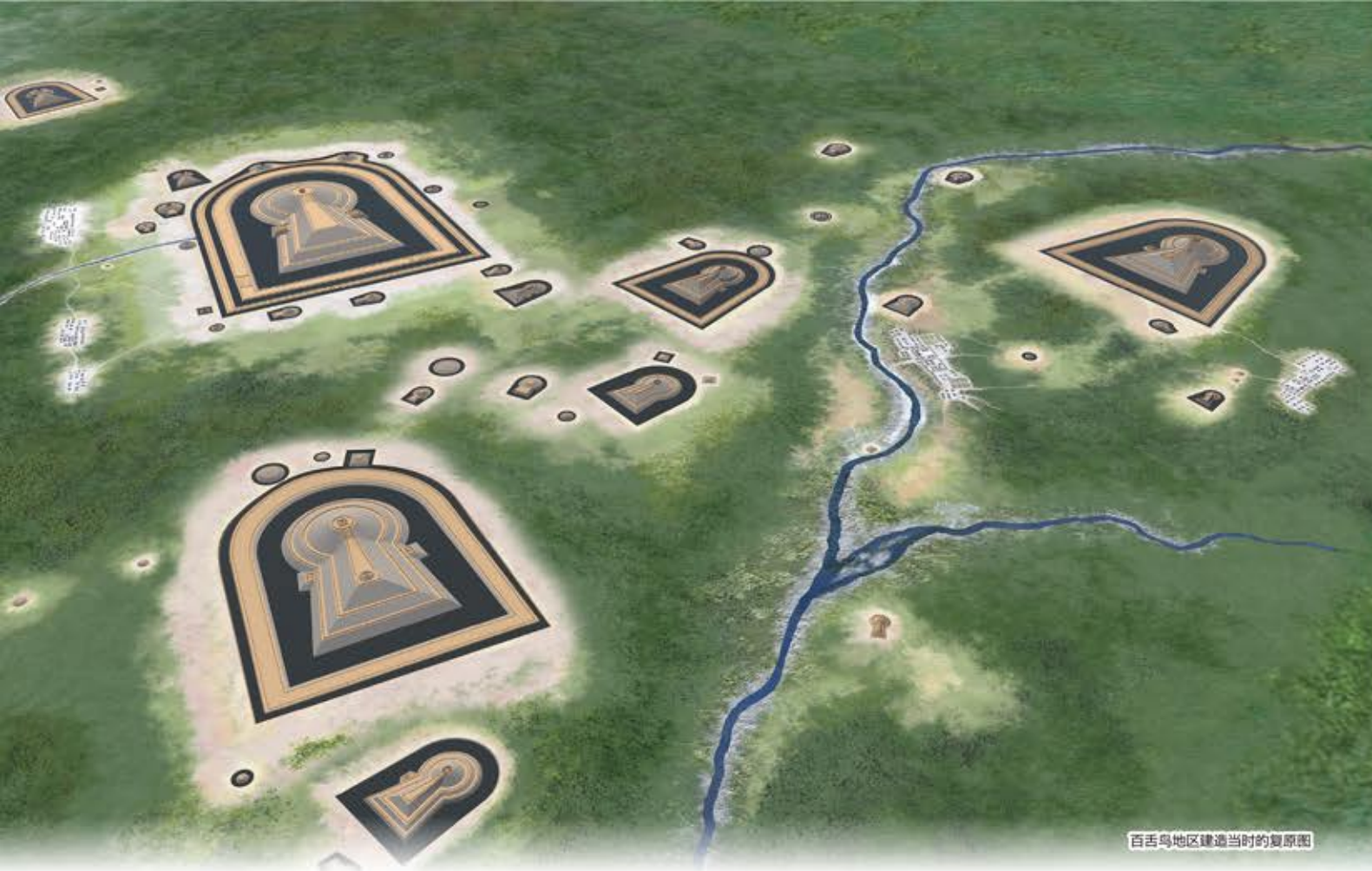
百舌鸟地区建造当时的复原图