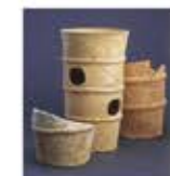
钱冢古坟出土的圆筒陶俑

A4 现在绿意盎然,像一片茂密的森林,但在建造之时却寸木不生。坟丘的斜面上铺着墓石,平坦的地方规则地摆放着许多由粘土烧制而成的陶俑,古坟被点缀得颇具生机。