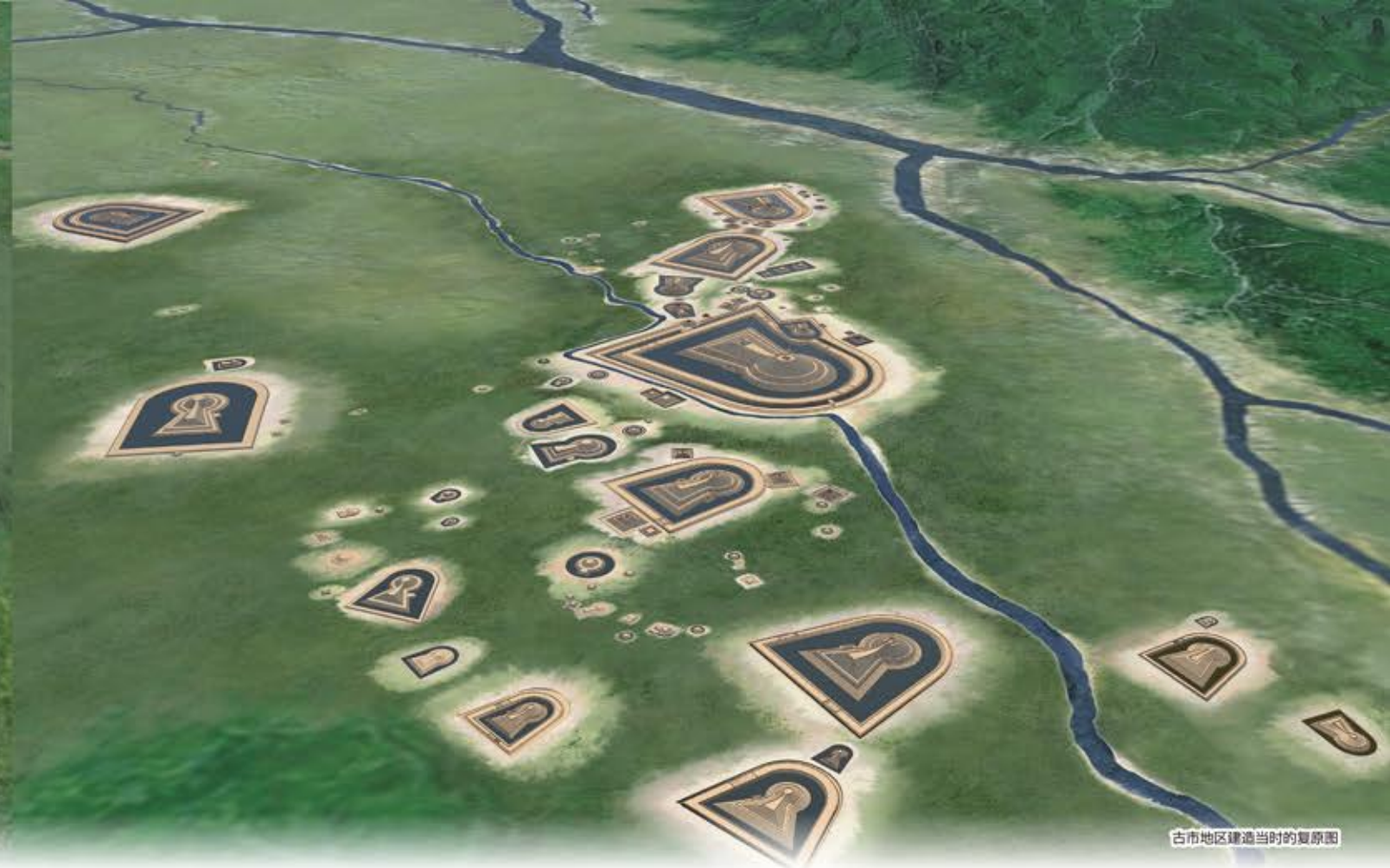
古市地区建造当时的复原图